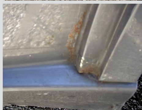
< Einstieg hinten