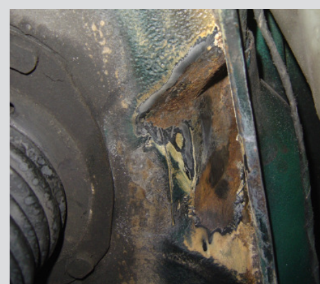
< Kotflügel vorne